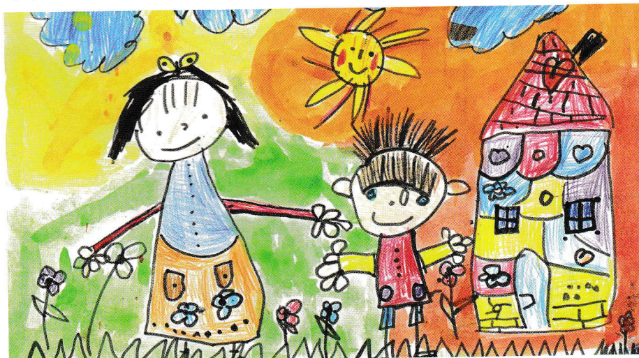
Obrázek z MŠ Sosnová, Třinec